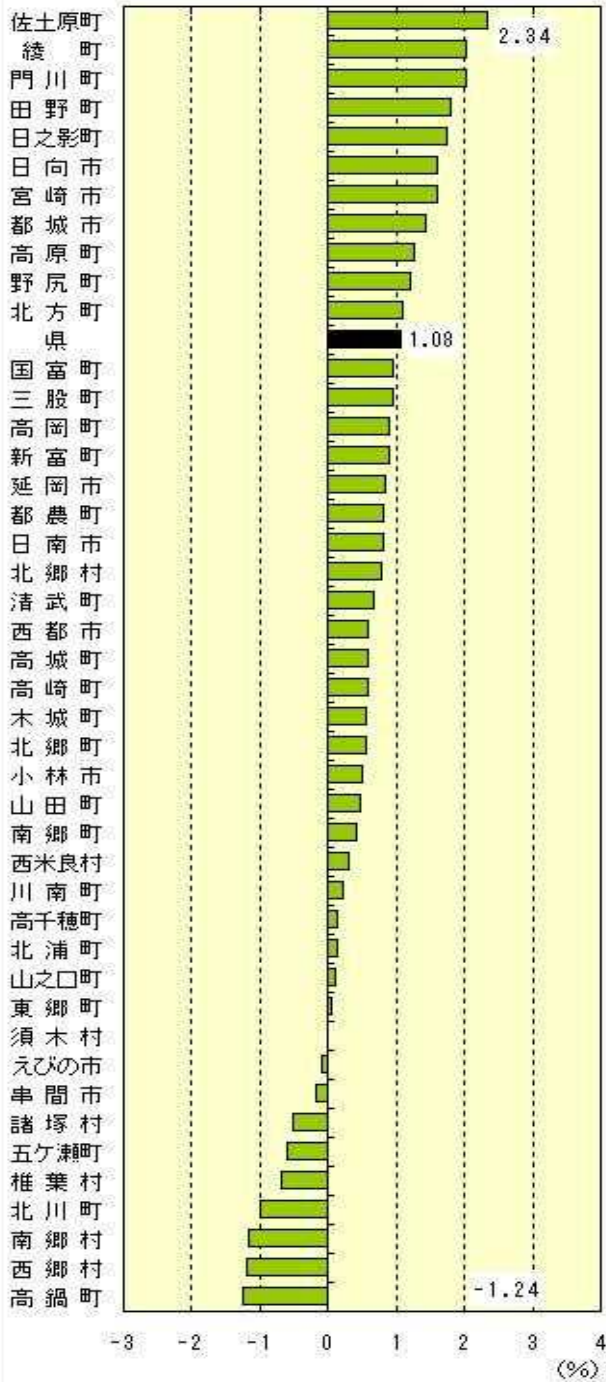
市町村別世帯増減率